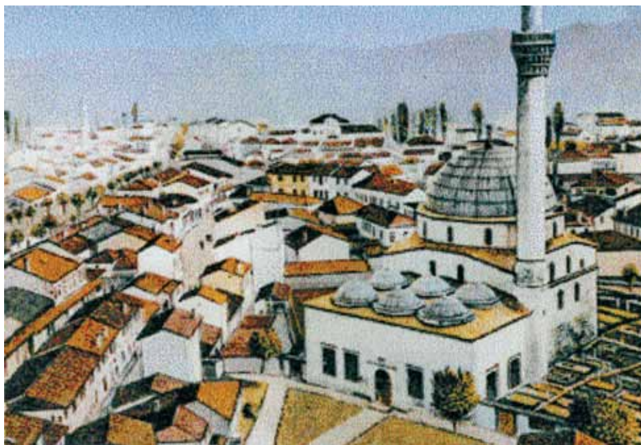
Сл. 1. Разгледница со Јени џамија од почеток на 20 век Fig. 1-a. Postcard of Yeni Mosque from the beginning of the 20 th century